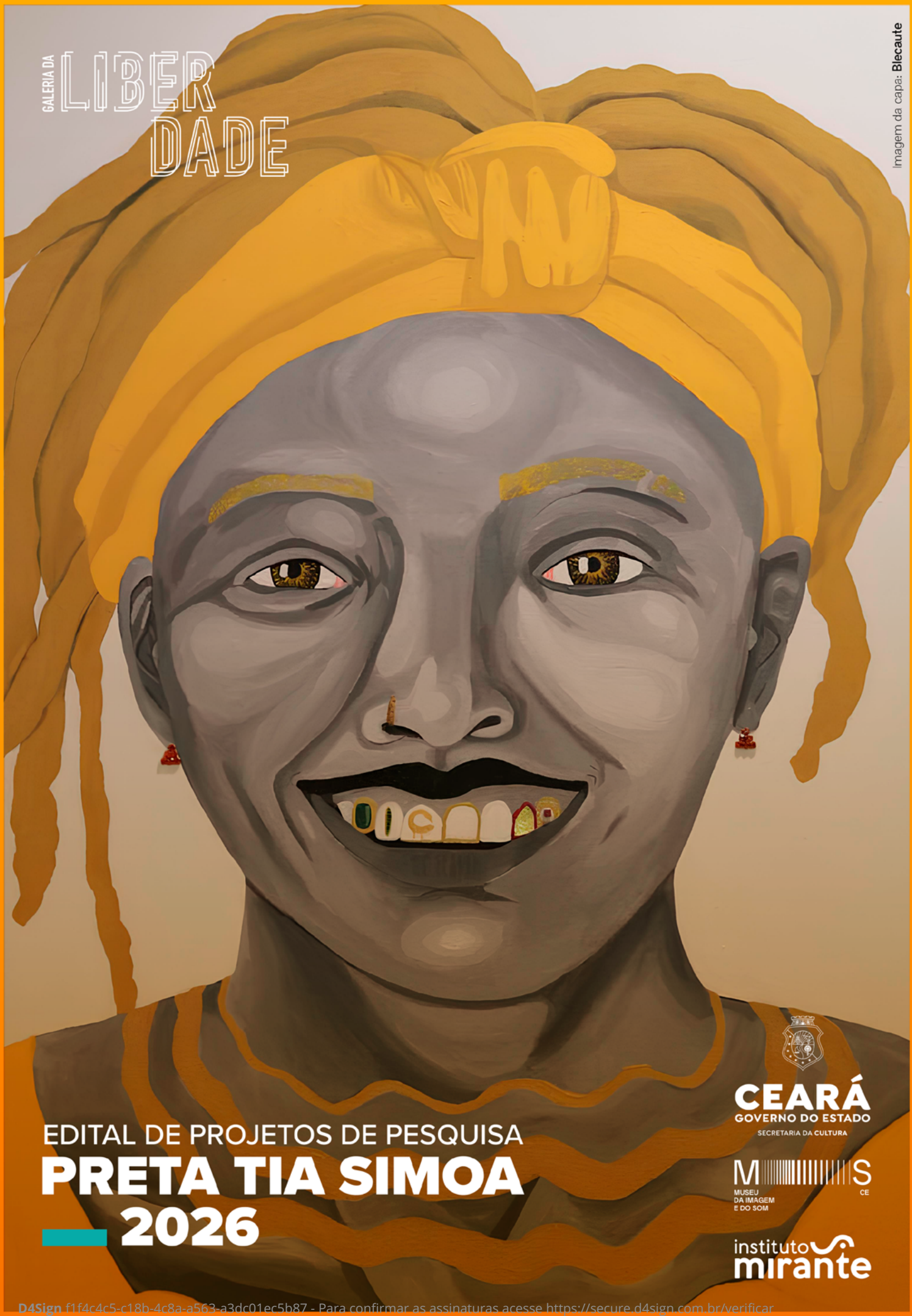
Imagem da capa: Blecaute